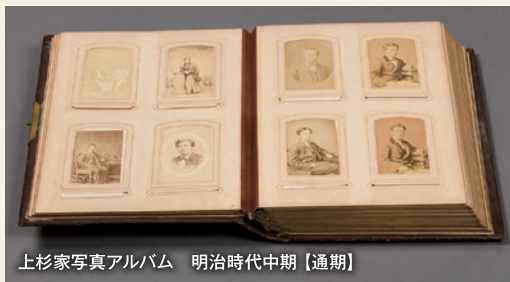
上杉家写真アルバム 明治時代中期【通期】