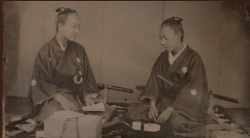
上杉茂憲と松平定敬(京都所司代) 慶応2年(1866)【通期】