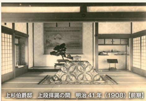
上杉伯爵邸 上段拝読の間 明治 41 年(1908)【前期】