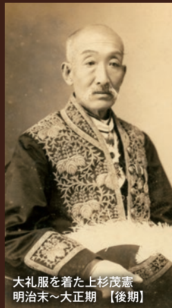
大礼服を着た上杉茂憲 明治末~大正期【後期】