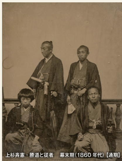
上杉斉憲・勝道と従者 幕末期(1860年代)【通期】