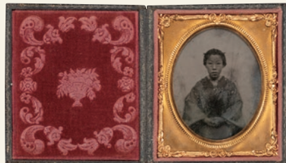
上杉曄(勝道夫人) 幕末期【通期】(当館蔵)