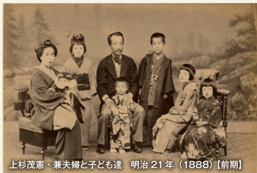
上杉茂憲・兼夫婦と子ども達 明治 21 年(1888)【前期】