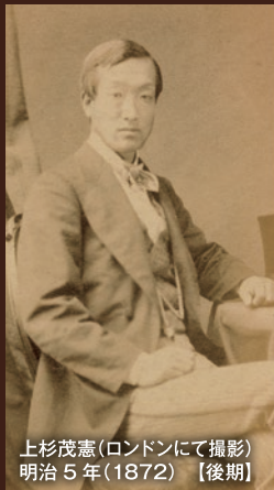
上杉茂憲(ロンドンにて撮影) 明治5年(1872)【後期】