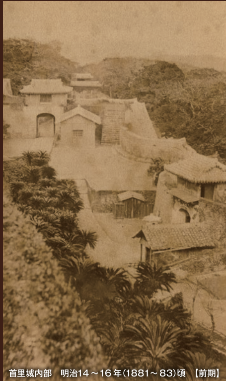
首里城内部 明治14~16年(1881~83)頃【前期】