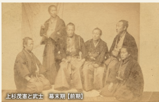
上杉茂憲と武士 幕末期【前期】

*展示資料のうち、2/3以上を前後期で展示替え。*以下、表記のない資料は個人蔵。*展示期間は変更になる場合があります。