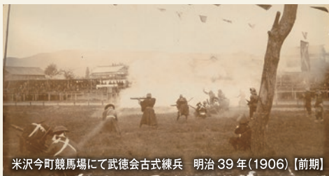
米沢今町競馬場にて武徳会古式練兵 明治 39 年(1906)【前期】